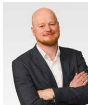
Welke waarden vinden mensen belangrijk voor het ambt van de burgemeester?

“Ik zou het vooral eens naar jezelf toe lezen. Dat klinkt gek. Ik bedoel hiermee, dat je de waardenanalyse leest en dat je bij elk waardencluster denkt: hoe zit dit bij mij? Wat zijn mijn diepgewortelde overtuigingen? Met welke waarden heb ik van nature minder, maar vinden anderen juist belangrijk voor een burgemeester? En dat je dan kunt aangeven, hoe komt dat? Waarom doe ik dat? Het waardenboek helpt je erg om te reflecteren op je eigen functioneren. Ik kan het iedereen aanraden om te lezen en te gebruiken.” ■