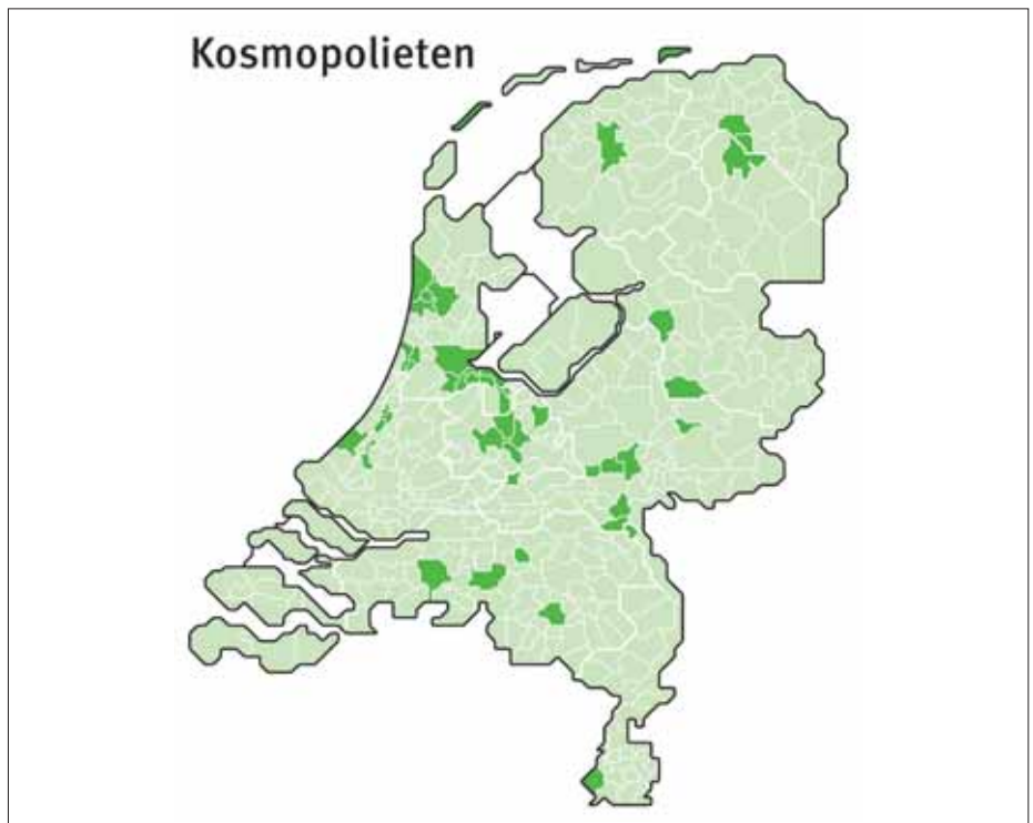
Figuur 3 - Gemeenten waar de som van de stemmen op D66, GroenLinks en PvdD bij de Tweede Kamerverkiezingen 2017 28 procent of meer is zijn donker gekleurd.

Als we de stemmen op verwante partijen optellen, worden hardnekkige patronen zichtbaar die soms zelfs teruggrijpen op bestandslijnen uit de Tachtigjarige Oorlog. Een voorbeeld is de 'Reli-riem' (figuur 2), waar de klein rechtse partijen (CU plus SGP) oververtegenwoordigd zijn. Daar tegenover staat de kruisende kosmopolitische as (D66 plus Groen Links en PvdD), van Alkmaar, via Amsterdam en Utrecht, naar Nijmegen, aangevuld met bijna alle studentensteden – te zien in figuur 3.