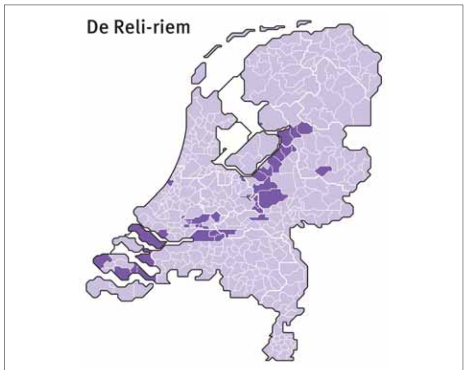
Figuur 2 - Gemeenten waar de som van de stemmen op ChristenUnie en SGP bij de Tweede Kamerverkiezingen 2017 18 procent of meer is zijn donker gekleurd.